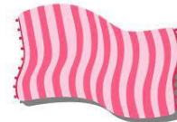
Ta serviette de bain

Merci de respecter le contenu des sacs demandés Les animateurs se chargeront de vérifier et d'enlever certaines affaires si nécessaire le temps de l'activité.