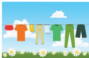
Des affaires de rechange (même si je suis grand je peux me mouiller durant une activité !!)