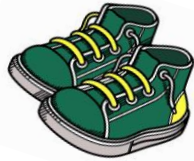
Des « baskets » ou chaussures fermées