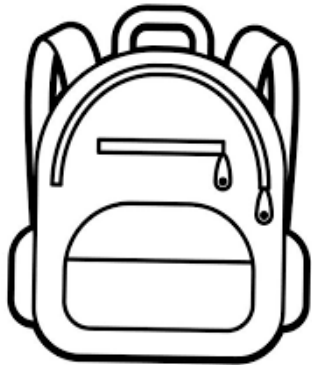
Un sac à dos que je peux porter