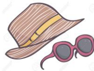
Une casquette ou un chapeau